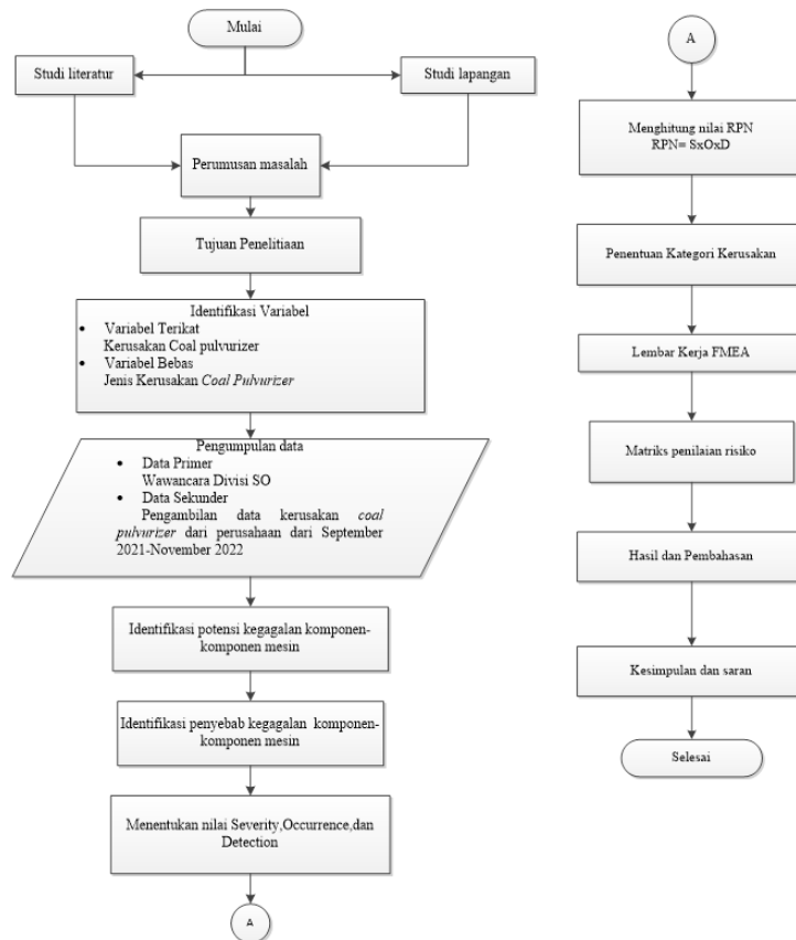
Gambar 2 Flowchart Penelitian

Dari penjelasan diatas dapat dijelaskan secara jelas dengan flowchart penelitian dibawah ini: